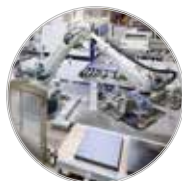
Großtischlerei mit modernstem Maschinenpark