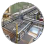
Rund 4.000 m2 große Holzfertigung inklusive