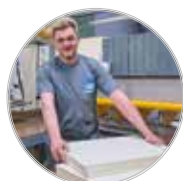
25 Mitarbeiter*innen mit Engagement und Fachwissen in der Produktion